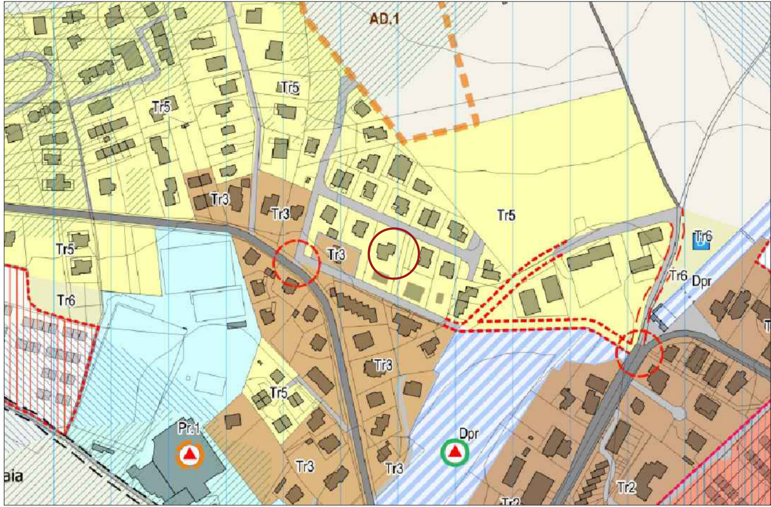
PRG.PS - Tr - Foglio 92 Part. 404