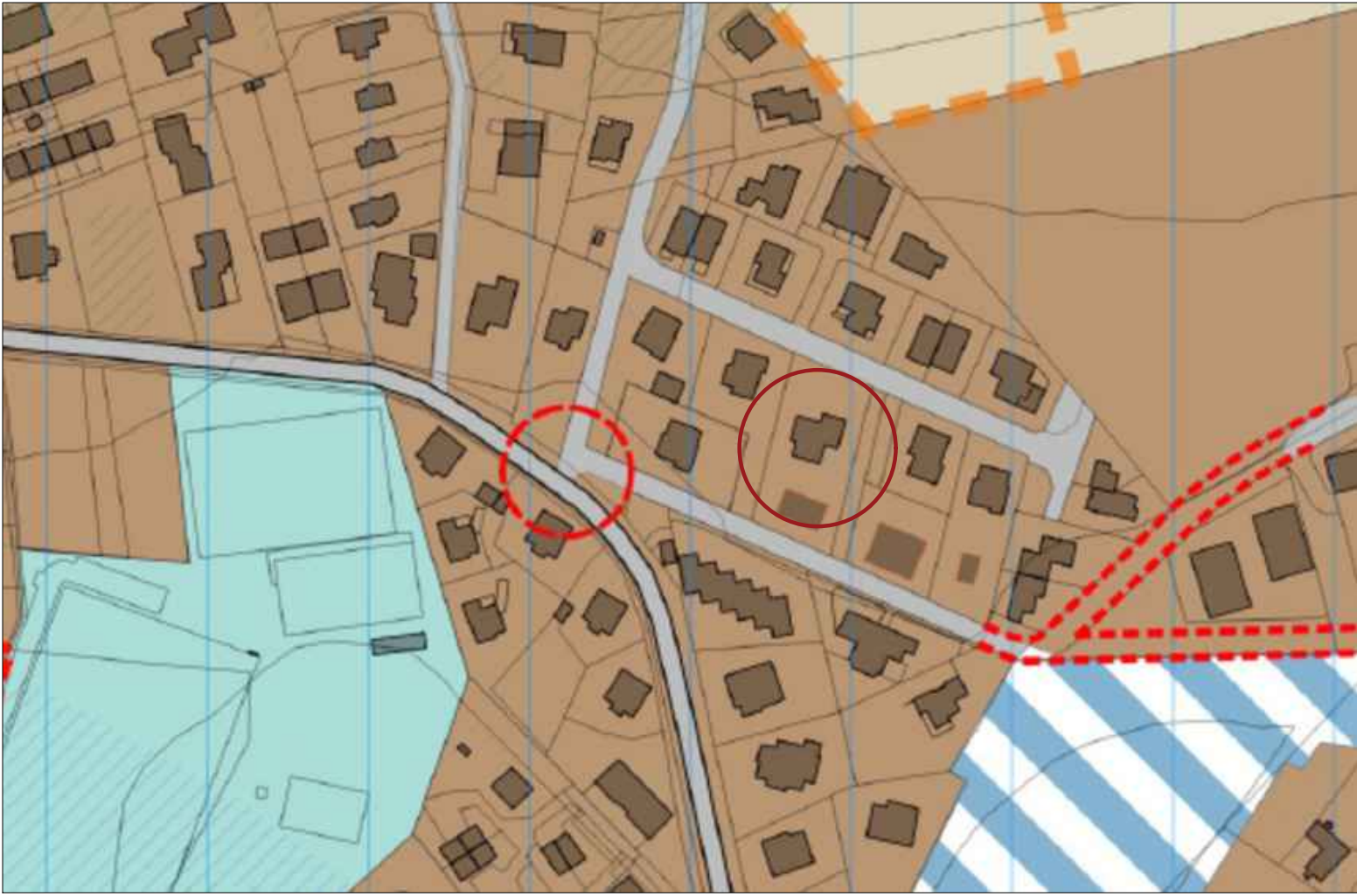
PRG.PO - Tr5 - Foglio 92 Part. 404